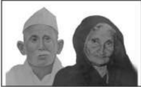
પૂજ્ય પરદાદી-દાદા : વીશા મા કાંચા ગાલા